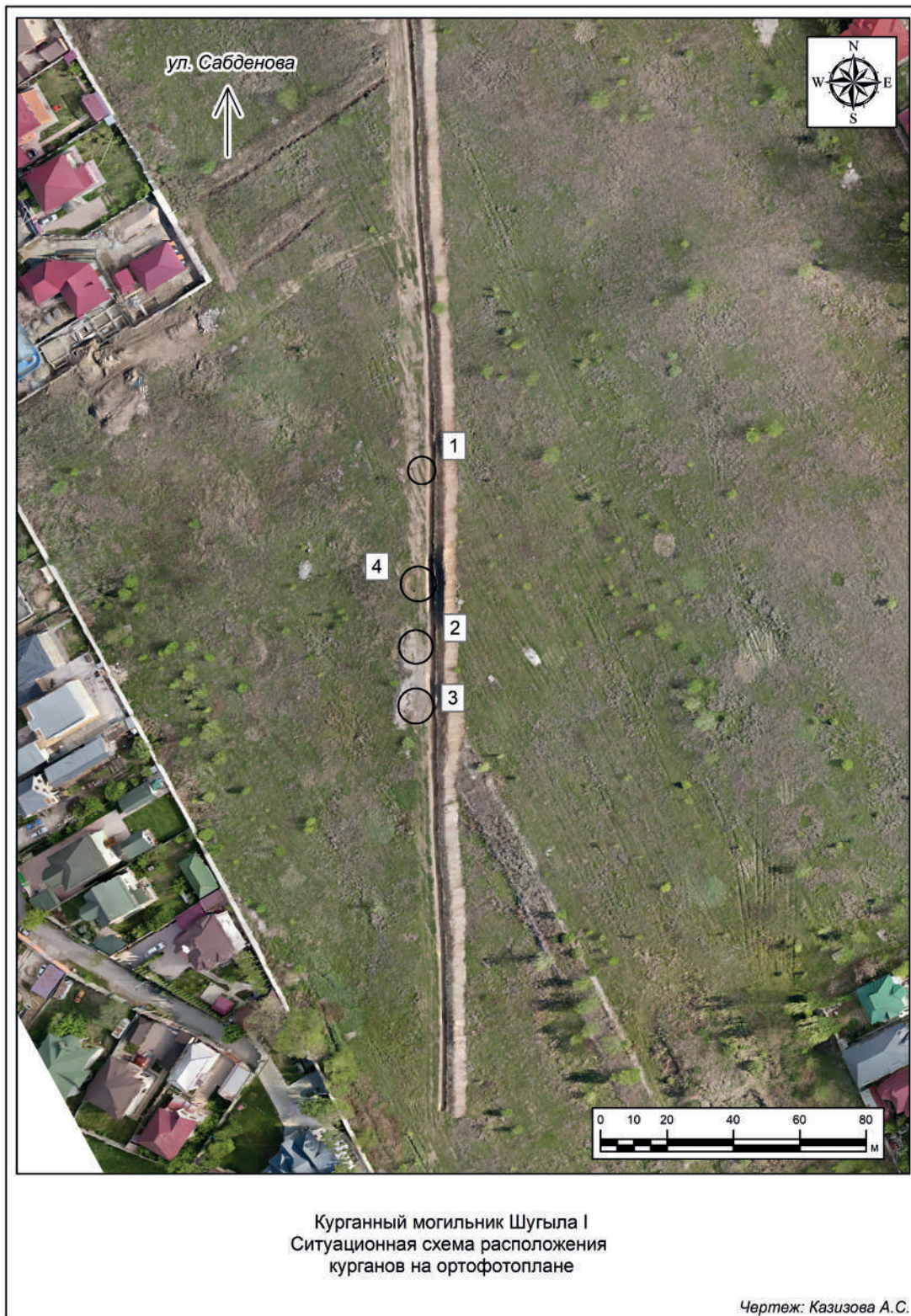
Рис. 1. Ситуационная схема расположения курганов на ортофотоплане